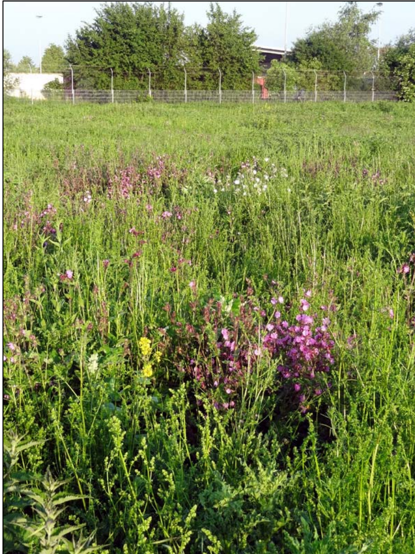
Abb. 3: Nordteil des Plangebietes mit feuchter Hochstaudenflur (Blick nach Nordwesten); im Vordergrund Blühaspekt mit Roter Lichtnelke ( Silene dioica ) am 01.06.2019