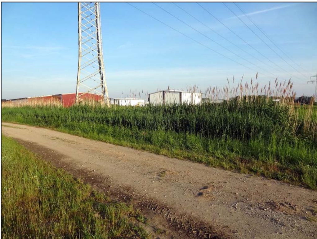
Abb. 2: Wirtschaftsweg im Norden des Plangebietes, zwischen KES und ‚Borsigring‘, mit schilfbestandenem Wegeseitengraben (Blick nach Westen)