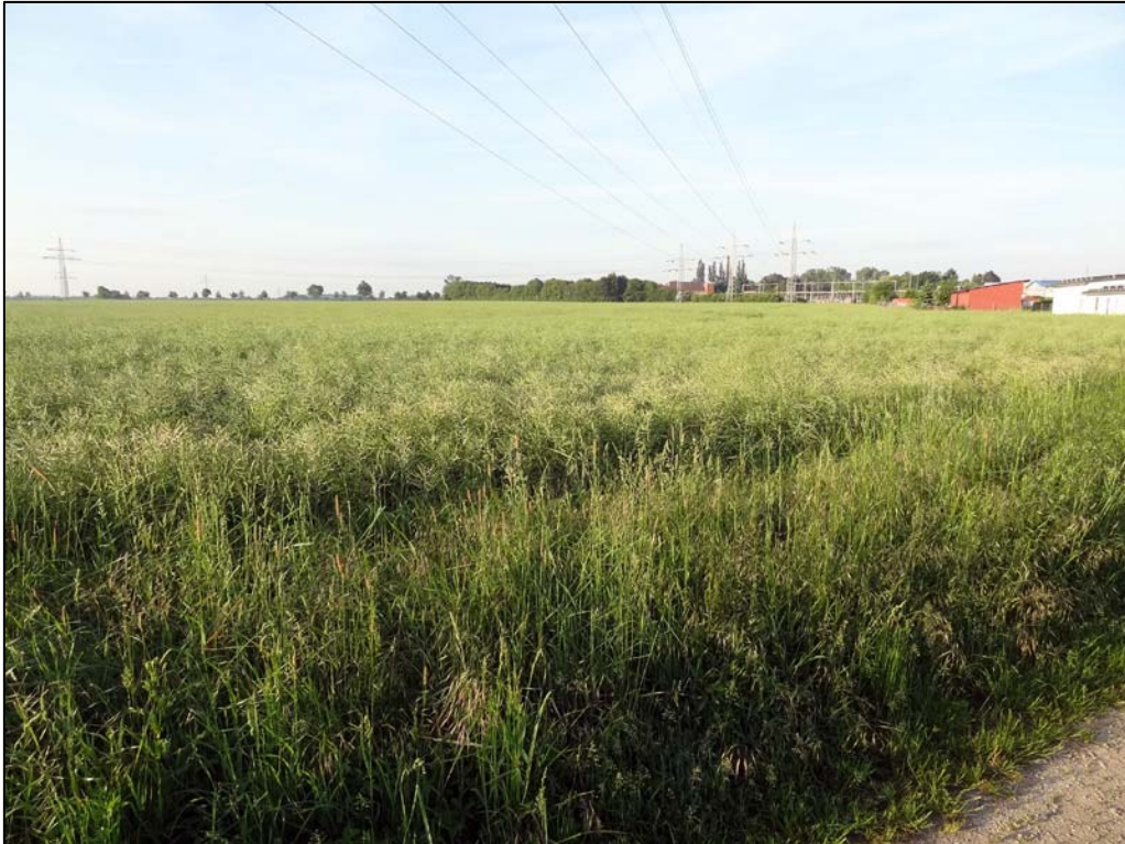
Abb. 1: Blick von Nordosten über den zentralen Ackerbereich des Plangebietes; im Hintergrund befindet sich das Umspannwerk der Avacon AG.